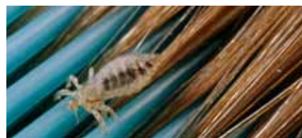
Hoofdluis op een kam.